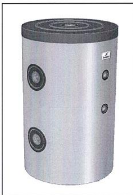
PT HC ...

A nyilatkozat tárgya / object of the declaration / Gegenstand der Erklärung / Objet de la déclaration / Предмет декларации / Předmět prohlášení / Obiectul declarației: