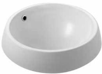
Nur 47 ráültethető mosdó 47 cm 7014 47 xx

Az Alföldi új családja számtalan variációs lehetőséget kínál a fürdőszobában a mosdók széles választékának köszönhetően. A ráültethető mosdókkal igazán különleges, egyedi megjelenés alakítható ki. Az új nyitott gyűrűs, CleanFlush fali-WC pedig ma már standard megoldás a fali-WC-knél, használatával a WC egyszerűen és gyorsan tisztán tartható, miközben nem kell tartanunk a víz kifröccsenésétől sem. Ráadásul, pedig - bizonyos feltételek mellett - a 3/4,5 literes öblítésnek köszönhetően még vizet is spórolhatunk. A család minden tagja választható a takarítást jelentősen megkönnyítő Easyplus mázfelülettel.