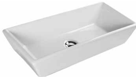
Now 66 ráültethető mosdó 66 x 29 cm 7016 65 xx