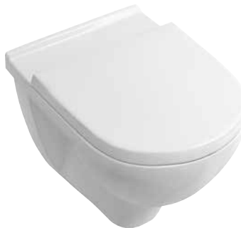
Mélyöblítésű fali-WC 4V99 RO xx WC-ülöke: 8M38 S1 01, 8M39 61 01