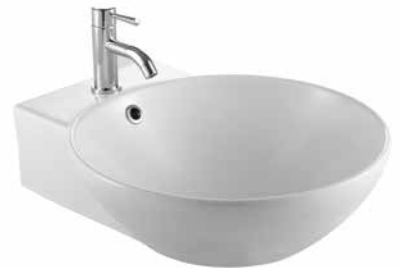
Dew 47 mosdó 47 x 56 cm 7019 47 xx