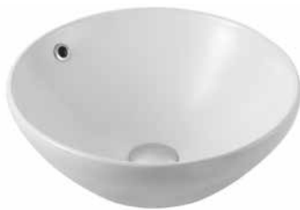
Dew 47 ráültethető mosdó 47 cm 7029 47 xx